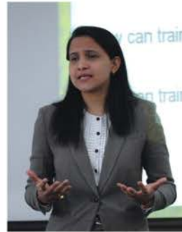
Gupta Associate Professor